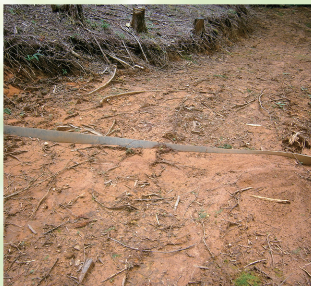
上流側からの様子