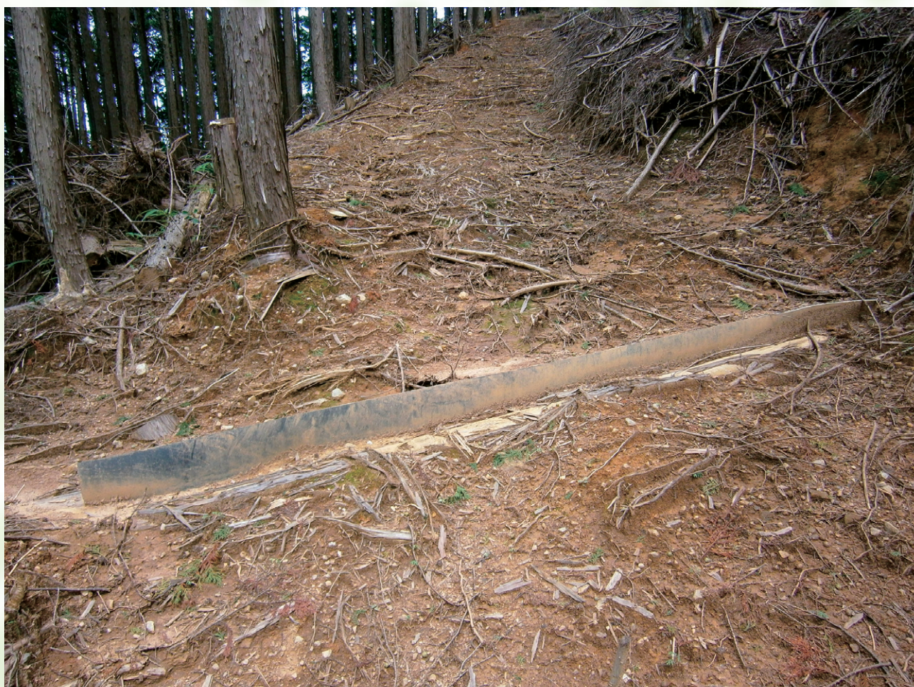
下流側からの様子