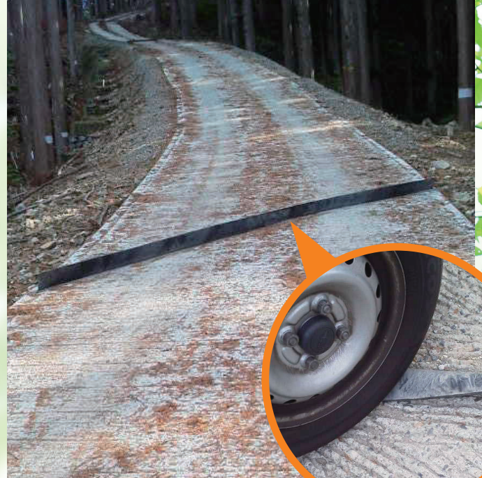
コンクリート舗装路面