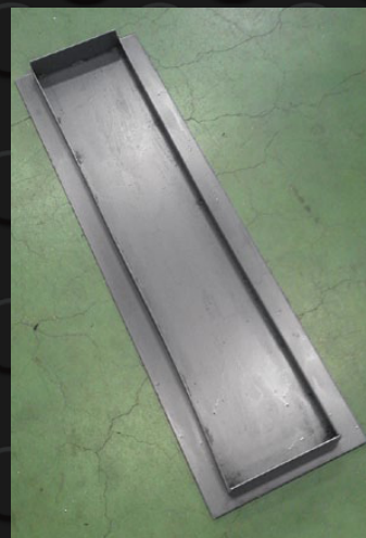
歩道用タイプの裏面