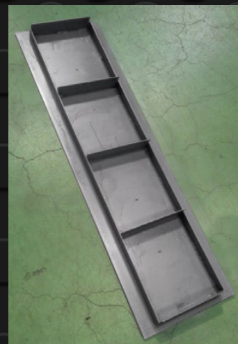
乗用車用タイプの裏面

製品寸法概略：溝内幅240mmまで適用 長さ990×巾306×厚み12 (mm) 色調：黒 製品概略：歩道用と乗用車用の2種類あり。 内部鉄板厚み3.2、及び4.5 (mm)